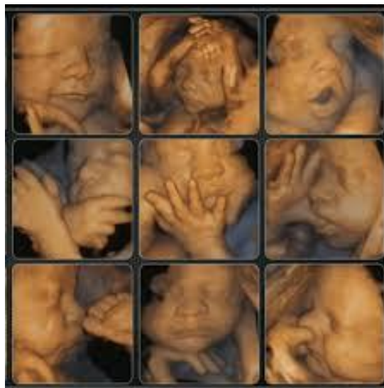
Рисунок 4. Ультравысокое разрешение с автоматической сегментацией структур плода. Чётко видны мелкие детали, такие как пальцы рук и черты лица, с минимальными артефактами.